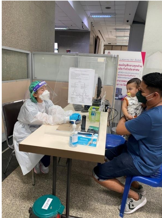
8.3.5 ตรวจสอบเชื้อ COVID-19 (โดย swab ที่ผู้ด้านนอก ARIP)