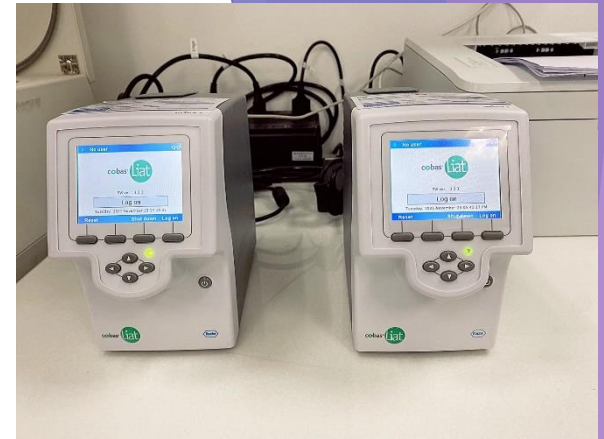
% การรายงานผลในเวลาที่กำหนด